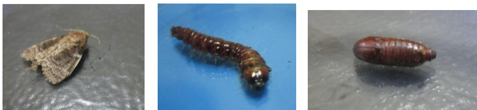
Gambar 1. Siklus hidup Coccus coccus

Telur Cossus cossus disisipkan diantara celah-celah kulit kayu dimana perkembangan embrio telur berlangsung selama 12 sampai 15 hari. Larva Cossidae memiliki karakteristik yang mencerminkan cara hidup mereka, mengebor pada kayu dan batang. Kepala besar, lebih panjang dan lebar dengan rahang besar. Prothorax berbentuk seperti plat yang khas atau perisai yang memiliki ekor margin halus pada Cossus (Southdene Sdn,1986 : 11 ).